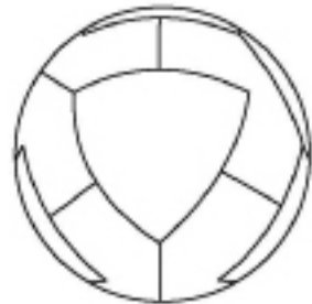
X - BALL