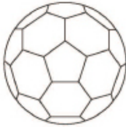
CLASSIC 32 PANNELLI